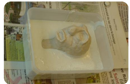
Et hop dans la vaseline

4- Lorsque tout est sec (environ 1 ou 2 journée). Démouler