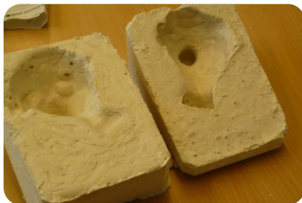
On obtient ceci !